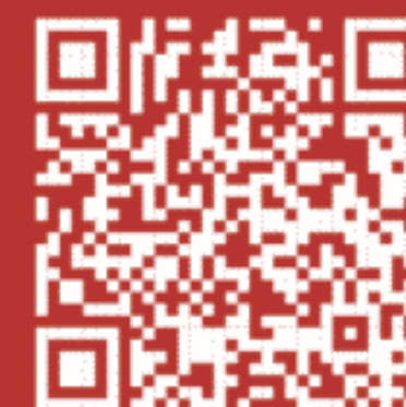
Tableau de la géographie littéraire est un livre numérique en libre accès contenant des liens et une bibliographie Zotero.

Cet ouvrage a été soutenu financièrement par le laboratoire TREE (TRansitions Énergétiques et Environnementales), UMR 6031 de l'UPPA